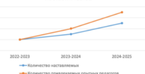
Динамика участия педагогов в программе наставничества

С документами и результатами мониторинга можно ознакомиться здесь